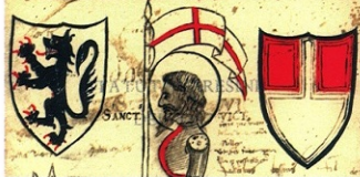
Sopra: particolare della pagina minata degli Statuti Varesini del 1347.

Anno dñi mcccxxxviii Indictio vii die feco mñs pñsantia In regimine nobilitas et pñsantia tñm dñm dñm de vñs de luncana hñe ab utaq' vñs pñsantia et dñm vñs de mñs de mñs mñs mñs mñs mñs mñs mñs de dñm de mñs de mñs de mñs de mñs de mñs de mñs de mñs de mñs de mñs de mñs de mñs de mñs de mñs de mñs de mñs de mñs de mñs de mñs de mñs de mñs