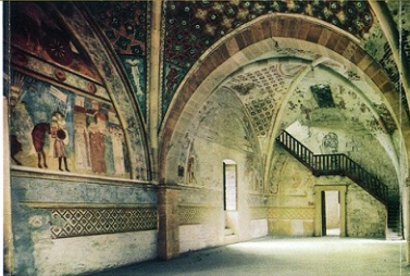
A fianco: sopra, la Sala di Giustizia nella Rocca di Angera; sotto, Italia Gallica sive Gallia Cisalpina, 1674.