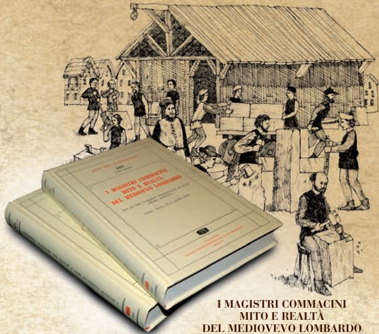
I MAGISTRI COMMACINI MITO E REALTÀ DEL MEDIOEVO LOMBARDO